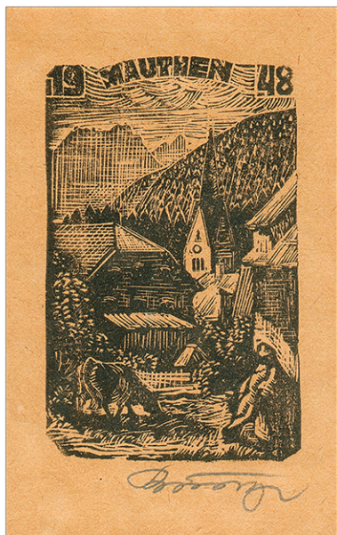
Adalbert Kunze (1914 – 2006 Mauthen): Holzschnitt „Mauthen 1948“, mit Bleistift handsigniert, Format 5,8 x 9,2 cm.