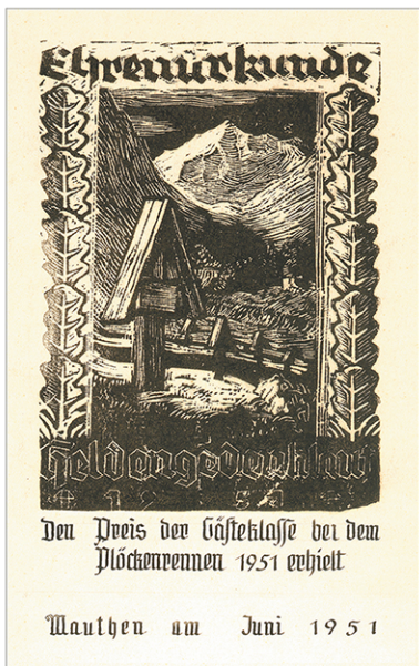
Adalbert Kunze: (1914 – 2006 Mauthen): Holzschnitt aus dem Jahr 1951, „Heldenfriedhof Plöckenstraße mit Rauchkofel“, Urkunde der Gästeklasse beim Plöckenrennen 1951, Format ca. 10 x 16 cm.