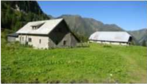
Obere Bischof Alm

9. GRENZGÄNGER WANDERMARATHON Samstag, den 10. August 2024 Start um 06.00 Uhr Anmeldung unter: Grenzgänger Marathon – OEAV Obergailtal-Lesachtal (oav-obergaital.at)