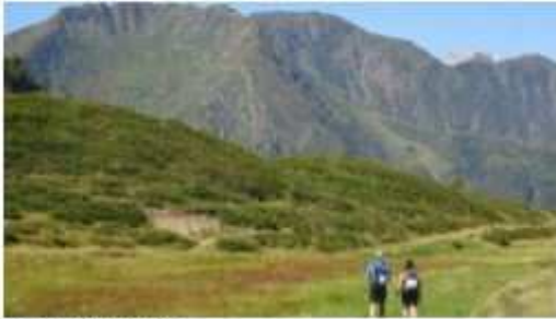
Zollner Alm mit Köderhöhe