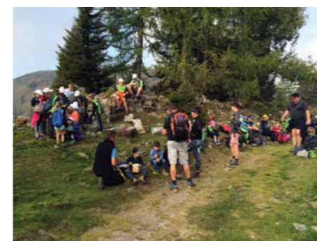
Bild: Rast beim Aufstieg zum Zollner See