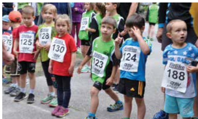
Foto rechts: Schon die Kleinsten konzentrieren sich beim Start