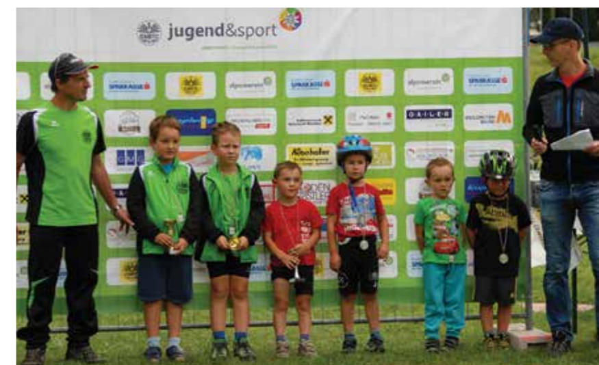
Bild: Schon die Kleinsten sind dabei und freuen sich über ihre Trophäen

Die ÖAV-Sektion, das Organisationsteam und die Trainer bedanken sich bei unseren Partnern und Förderern für ihre großzügige Unterstützung. Durch ihren finanziellen Beitrag schaffen sie die Basis, unsere Arbeit für die Kinder und Jugendlichen so erfolgreich durchzuführen.