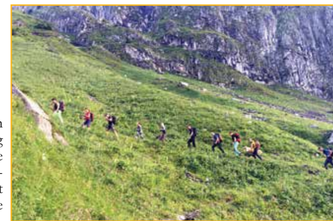
Foto: Anmarsch über die Prachtwiesen zur Grünen Schneid