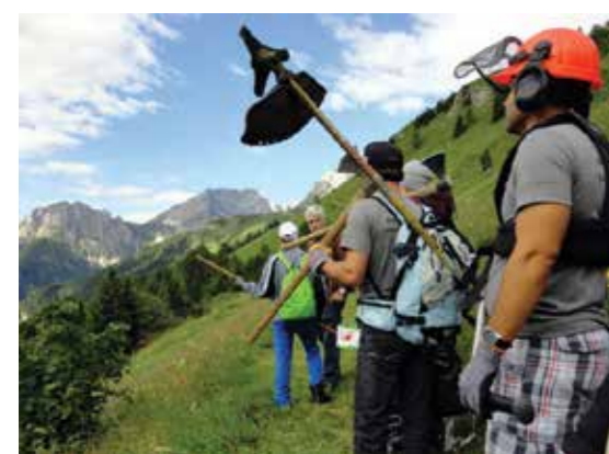
Bild links: Andreas Prugger weist Mitarbeiter für die Wegsanierung, Mäharbeit und Wegmarkierung ein