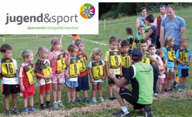
Bild: Vor dem Bambini -Start in Laas