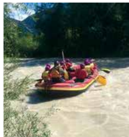
Bild: Im Raftingboot auf der Gail

Der Sektionseigene Hochseilgarten wurde auch wieder mutig durchklettert – auch wenn es für den einen oder anderen eine sehr wackelige Angelegenheit war ;)