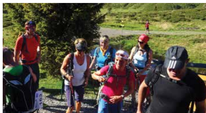
Foto: Die Ankunft bei der Zollnersee Hütte wurde gefeiert

Die Idee des umtriebigen Alpenvereinsobmannes zur Durchführung dieses ersten Bergmarathons, bezeichnet als „1. Grenzgänger - Primo Frontaliero“ mit Start und Ziel im Bergsteigerdorf Mauthen (710 m), hatte voll eingeschlagen und lockte 77 Teilnehmer aus Deutschland, Oberösterreich und Kärnten an den Start.