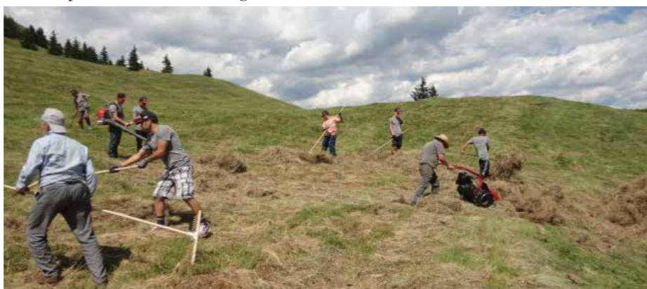
Foto: Die Helfer tatkräftig beim Mähen und Rechen auf der Mauthner Alm

zung dieses Heus sowie dessen Finanzierung diskutiert und als Denkanstoß für die Zukunft in den Raum gestellt.