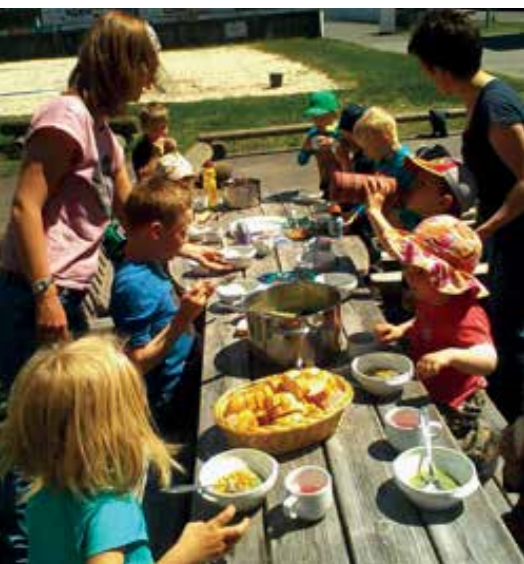
Foto: Die grüne Suppe schmeckt

Die vier- bis siebenjährigen Mädchen und Buben schlumpften bei jedem Treffen eifrig mit. Eine Querfeldein-Wanderung von Mandorf über Höfling zum Gaiddamm brachte herrliche Ideen Waldfeenhäuser zu bauen und Bäume blind zu ertasten. Welch eine Überraschung, dass Kinder so gern eine grüne Suppe essen?! Bei einem Treffen stand die Brennessel im Mittelpunkt. Mit Begeisterung