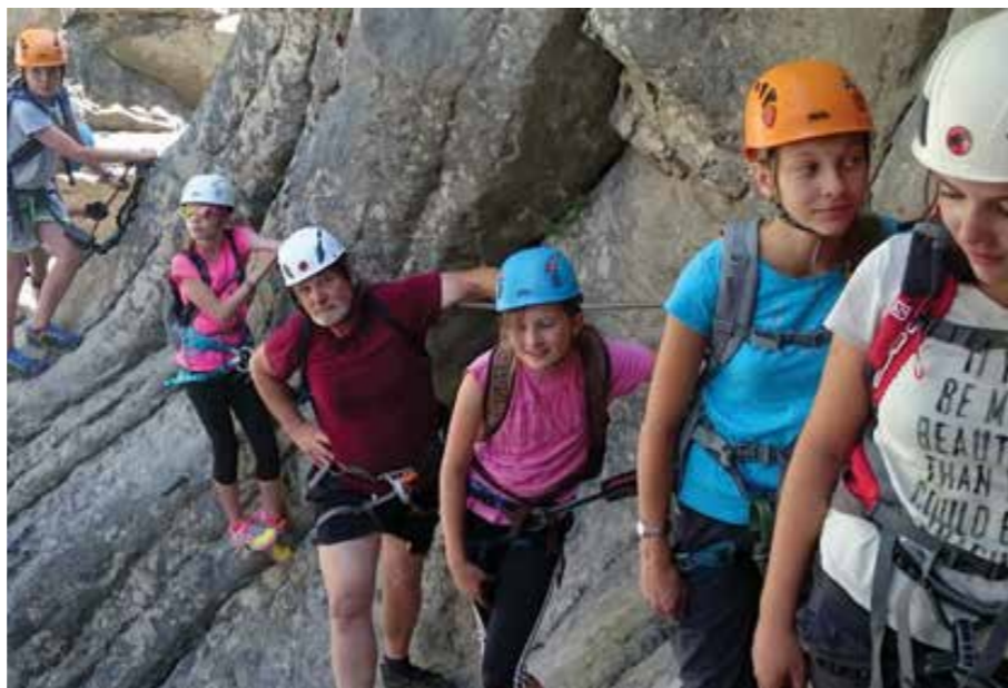
Bild: Im Schluchten-Klettersteig der Pirkner Klamm