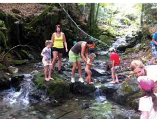
Foto: Im Einsiedelwald-Bachbett

Wir treffen uns einmal im Monat um gemeinsam etwas zu unternehmen. Gebt uns Bescheid und wir informieren euch rechtzeitig über die aktuelle Aktivität.