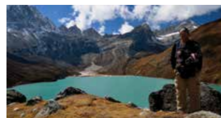
Foto: Gokyo lake

Alle diese exotischen Wanderungen haben mir die Wertschätzung und Bewunderung für unsere heimische Bergwelt gelehrt.