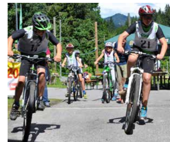
Foto: Der Start zum MTB-Rennen erfolgte im Zeitabstand des Vorsprunges im Klettern