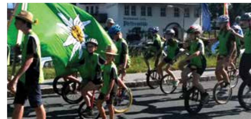
Bild: Mit den Einrädern beim Umzug anlässlich des Käsefestivals