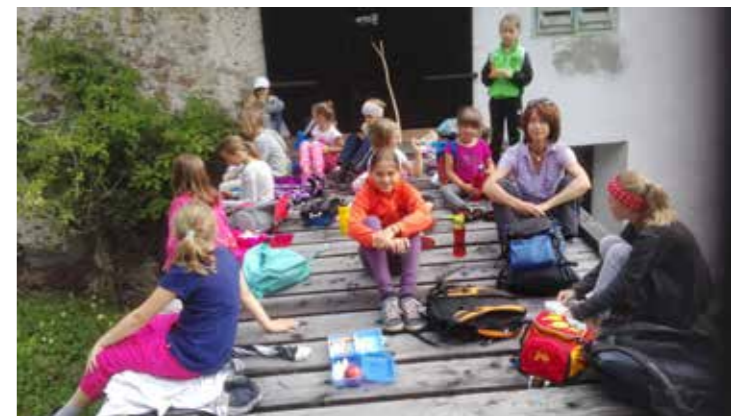
Bild: Wohlverdiente Pause beim Blaahaus