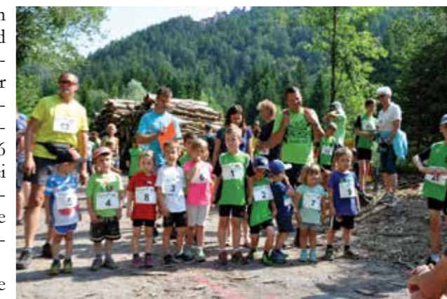
Foto: Wie immer ein starkes Bambini-Starterfeld

der die Erwachsenen zur Gailberghöhe und wieder zurück ins Gailbergmoor führte. Vier Laufgruppen (8 Kilometer) bzw. drei Nordic-Walking Runden (6 Kilometer) wurden bei sommerlichen Temperaturen bewältigt. Die Kinder feuerten die Erwachsenen freudig an! Vielen Dank für die zahlreiche Teilnahme an den diversen Bewerben!