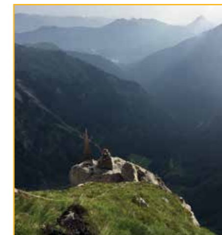
Foto: Die Pyramide auf der Grünen Nase