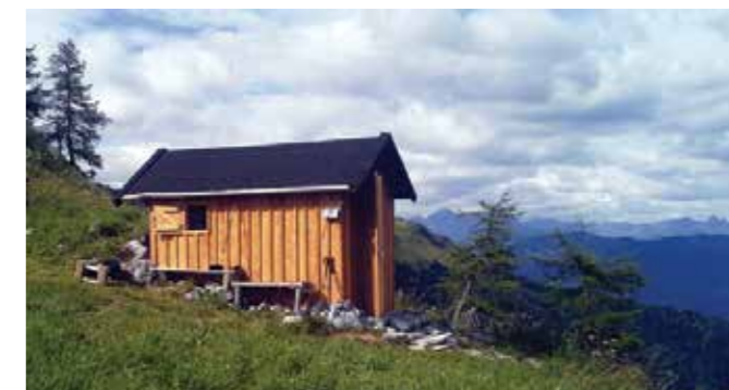
Foto oben: Die mit viel Liebe neu renovierte Bergdohlen-Hütte Fotos unten: Die Heuernte macht allen sichtlich Spaß

Es ist uns weiterhin ein riesiges Anliegen, dieses Plätzchen als kleine Festung des Naturschutzes, eingeschlossen von leider lauter ungepflegten ehemaligen Mähwiesen, noch möglichst lange zu betreuen. Gruß von den Bergdohlen-Betreuern Heinz, Gerhard und Ewald