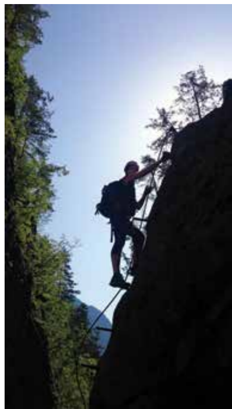
Bild: Im Schluchten-Klettersteig