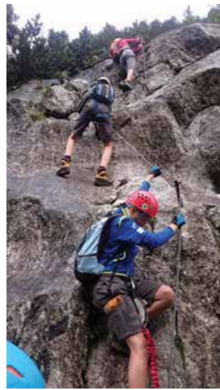
Bild: Im Oberst Gressl Klettersteig