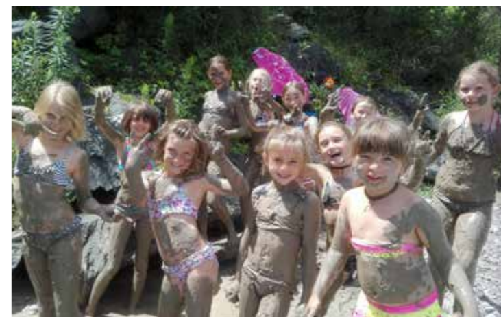
Bild: So sehen glückliche Gatschhüpfer aus

nen schönen Abschluss unserer Erlebniswoche.