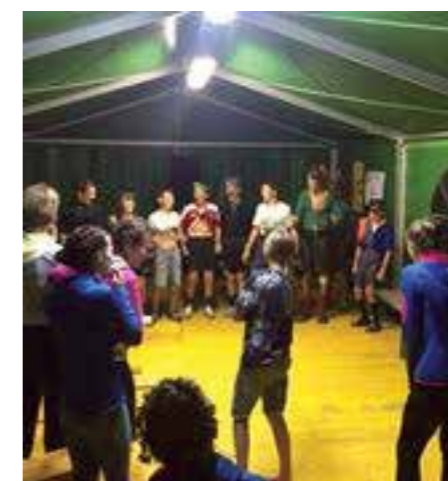
Bild: Beim Theaterabend