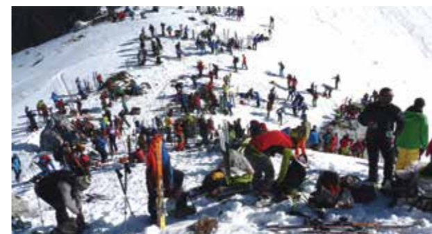
Reges Treiben vor dem Start auf dem Wodner Törl