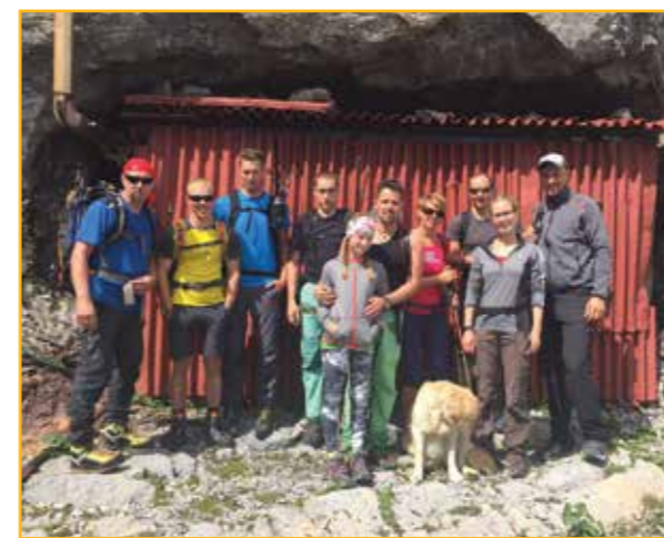
Foto: Die Gruppe vor der Eiskar-Kaverne