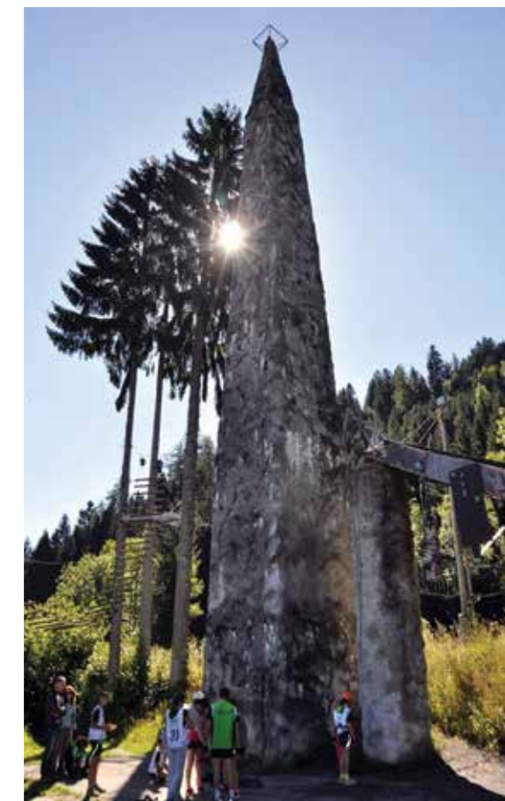
Foto: Die Herausforderung Kletterturm