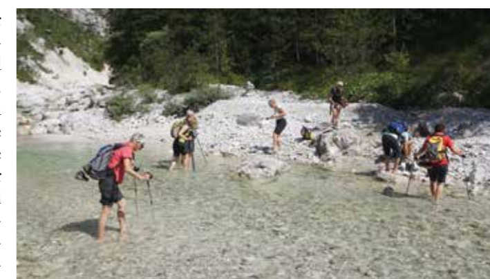
Foto: Die Truppe beim Furten des Bachbettes

Im Sommer dauerhaft bewohnt sind nur eine Handvoll Häuser, wobei es angeblich in Moggessa di qua eine Bewohnerin geben soll, die auch den Winter in dem Ort verbringt.