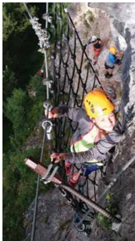
Bild: Im Felsen-Garten Oberdrauburg