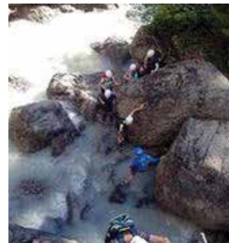
Bild: Im Klamm-Klettersteig

Die Zielgenauigkeit haben wir beim Bogen- und Biathlongewehrschießen geschult, da waren ein paar super Scharfschützen dabei! Wenn es wieder einmal zu heiß für große Bergabenteuer war, wurde das Naturschwimmbad gleich nebenan gestürmt – und Gott sei Dank ist im Bistro nie das Eis ausgegangen.