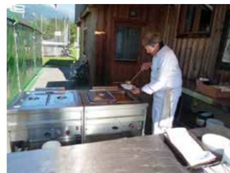
Foto: Gustl Berndnik versorgte die Athleten mit feinstem Eintopf aus der Küche von Franz Guggenberger - Hotel Erlenhof

Im Ziel gab es nur glückliche Gesichter, die sich über ihre persönliche Leistung freuten und lautstark die Fortsetzung im nächsten Jahr forderten.