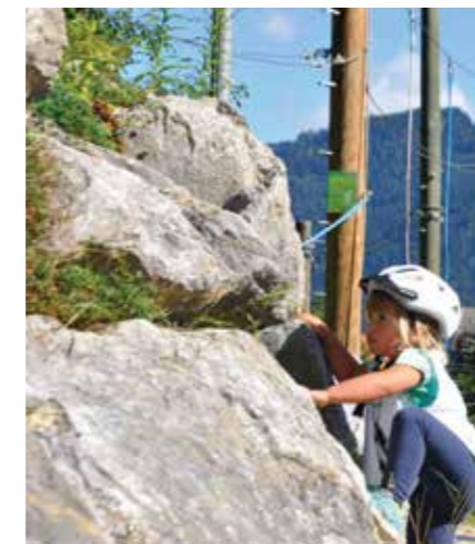
Foto: Aufstieg auf die riesige Felspyramide

mal leider niemand an den Start, obwohl oder gerade weil man ein Rennen auf die Durchschnittszeit angeboten hatte. Macht nichts, im nächsten Jahr hängen wir die Erwachsenen-Klassen mit gleichen Bedingungen wie die der Jugend, nur mit längeren Strecken am Vormittag an.