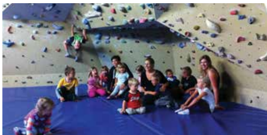
Foto: In der Boulderhalle

Die vier- bis siebenjährigen Mädchen und Buben schlumpften bei jedem Treffen eifrig mit. Eine Querfeldein-Wanderung von Mandorf über Höfling zum Gaiddamm brachte herrliche Ideen Waldfeenhäuser zu bauen und Bäume blind zu ertasten. Welch eine Überraschung, dass Kinder so gern eine grüne Suppe essen?! Bei einem Treffen stand die Brennessel im Mittelpunkt. Mit Begeisterung