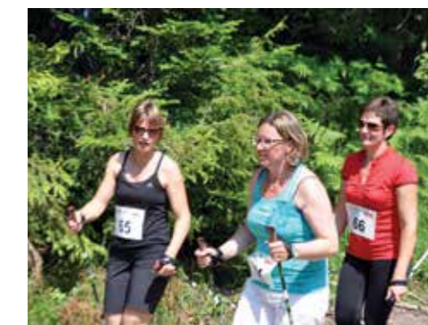
Foto: Ein starkes Trio unterwegs