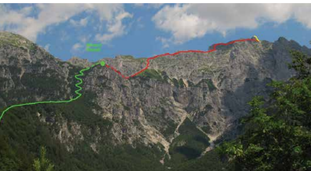
Foto: Das TOPO des Zuc dal Bor

Also noch einmal von vorne: Die Kinder spielten mit dem Computer, meine Frau war mal wieder mit ein paar Freundinnen zum Prosecco Trinken auf Achse und ich surfte durch die unendlichen Weiten des www, bis ich bei dem klingenden Namen „Zuc dal Bor“ hängen blieb.