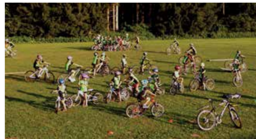
Bild: Reges Treiben beim Training für den MTB-Geschicklichkeitsbewerb

Nach der Saison ist vor der Saison und so wird schon fleißig an einem attraktiven Winterprogramm gearbeitet. Es ist allen ein großes Anliegen, die sehr guten Möglichkeiten für verschiedene Sportarten in Kötschach-Mauthen voll zu nutzen. Wo sonst kann man im Umkreis von nur wenigen Kilometern Schifahren, Langlaufen, Eislaufen und Schwimmen. Wir wollen den Kindern und Jugendlichen die Möglichkeit bieten, diese Sportarten zu erlernen bzw. bei den Trainings zu perfektionieren. Mit sportlichen Grüßen verbleibt das Team von ÖAV Jugend&Sport ÖAMTC