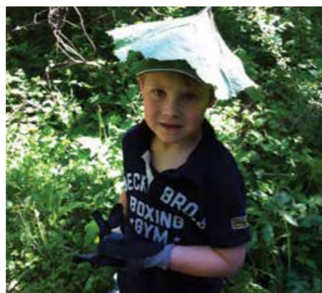
Foto: Auf der Suche nach Brennesseln