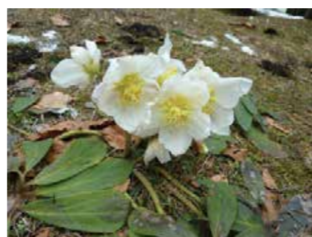
Foto: Schneerosen im Vrata Tal

Glas Rotwein nicht fehlen durfte. Weiter bis ins Ziel war der Schnee gerade noch erträglich. Der einsetzende Regenguss nach dem gemeinsamen Mittagessen wurde dank Rifugio Cocul trocken überstanden. Dass jeder Teilnehmer einen Schi-Sack erhielt, fand ich nett, das Pech, ein Dutzend Nieten für die Verlosung gekauft zu haben, weniger.