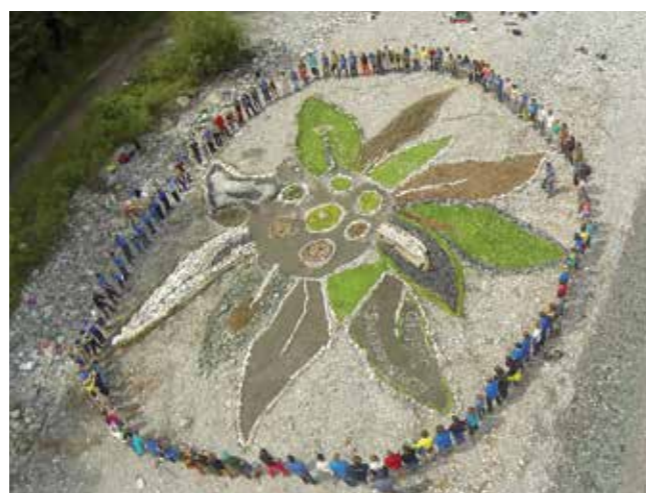
Foto: Das weltrekordverdächtige Edelweiß im Bachbett