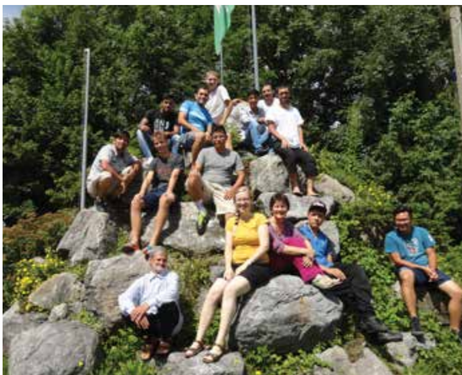
Foto: Einheimische und Asylwerber halfen gemeinsam bei der Alpenpflege

Im Rahmen der Umweltbaustelle des Österreichischen Alpenvereins von 17.-23. Juli 2016 halfen heuer bereits zum dritten Mal freiwillige Helfer bei den Mäharbeiten auf der Mauthner Alm sowie auch bei den Instandhaltungsarbeiten des Blumenwanderwegs bzw. den Karnischen Höhenwegs mit. In früheren Zeiten wurde das Heu über Seilbahnen ins Tal befördert. Zurzeit besteht jedoch keine Möglichkeit, das Almenheu einzubringen, wodurch es nicht als Futtermittel verwendet wer-