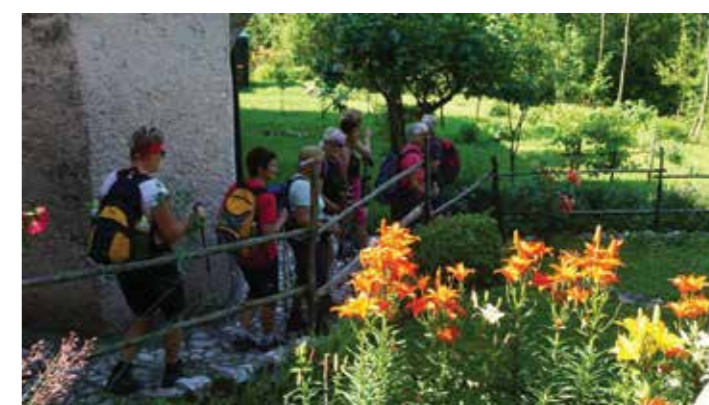
Traumhaft schöne Gärten zieren die verlassenen Dörfer