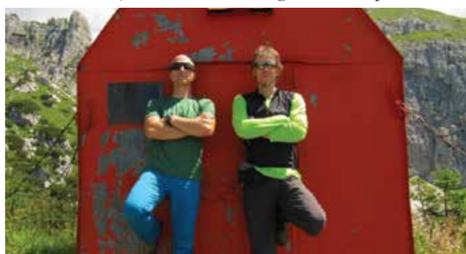
Foto: Vor dem Bivacco Bianchi

Beim Betrachten unserer beiden Rucksäcke gründe ich spontan eine