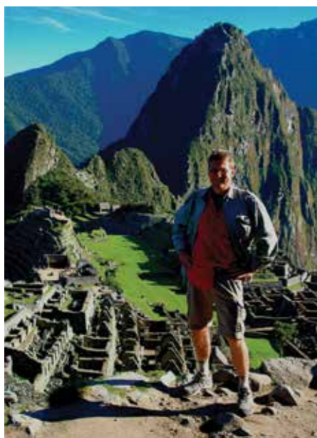
Foto: Machu Piccu

Es war 2005 (ich lebte mittlerweile schon über zehn Jahre in Montreal), rief mich ein guter Freund zwischen zwei Geschäftsterminen an und fragte mich, ob ich ihn nicht auf eine Reise nach Peru begleiten wolle. Ich sagte spontan zu, was mein Leben rückblickend doch ziemlich verändern sollte. Wir gingen den Inka Trail und zwischen zwei 4000 Meter hohen Pässen mit Blick auf das unglaublich schöne Panorama der riesigen Gipfel der Anden erwachte eine mir unbekannt Liebe zu den Bergen.