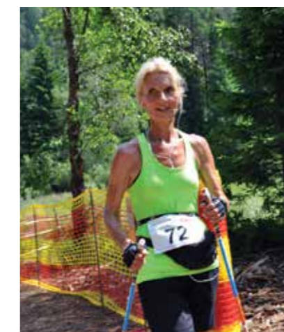
Foto: Die Walking-Siegerin im Ziel