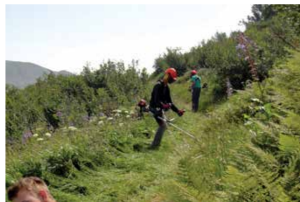
Bild rechts: Mühsame Mäharbeit auf dem Karnischen Höhenweg östlich des Zollnersees